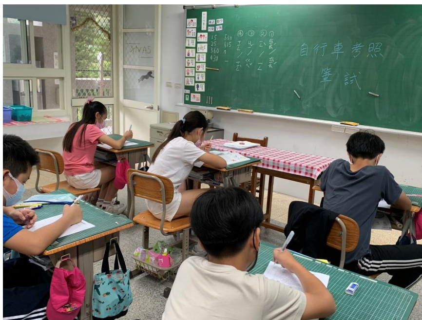
說明：自行車筆試測驗(高年級)