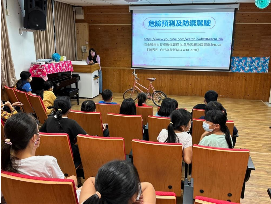
說明：自行車騎乘安全宣導