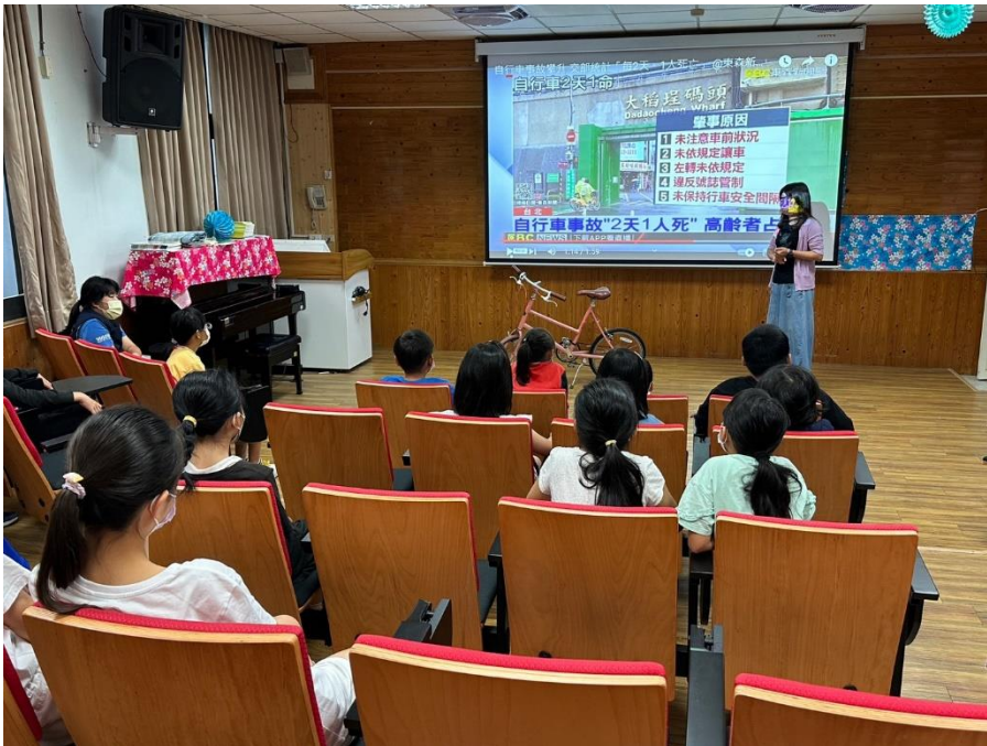
說明：自行車事故肇因報導